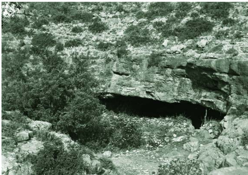
Vista de la Cueva de la Cocina (Dos Aguas). Cap a 1945. [Pasta. SIP 519]

La Cueva de la Cocina (Dos Aguas, València) s'obri en la serra de Martés a 405 metres d'altitud, en un acusat meandre del barranc de la Ventana que a poca distància desguassa en el barranc del Falón, afluent del Xúquer. Es tracta d'una cavitat de grans dimensions —uns 300 m 2 — que durant gran part de la primera mitat del segle XX va servir com a corral. Les intervencions efectuades en el passat segle pel Servei d'Investigació Prehistòrica de la Diputació de València van convertir Cocina en un jaciment imprescindible per a la definició de l'Epipaleolític recent de la vessant mediterrània peninsular (Pericot, 1945; Fortea, 1973), al contindre els seus estrats abundant documentació sobre l'evolució dels últims caçadors-recol·lectors i el procés d'interacció d'estos amb les primeres comunitats camperoles neolítiques.