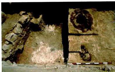
Forn de fundició. Penya Negra, de Crevillent. Horno de fundición. Penya Negra, de Crevillent.

L'aparició de la metal·lúrgia és el resultat d'un lent procés desenvolupat durant diversos mil·lennis i de manera independent en diverses parts del món, els orígens de la qual es remunten, en el Pròxim Orient, al IV mil·lenni a.C. A la península Ibèrica, la primera metal·lúrgia se situa en el 2500 a.C. associada a la primera fase de la Cultura de Los Millares en l'àrea del sud-est.