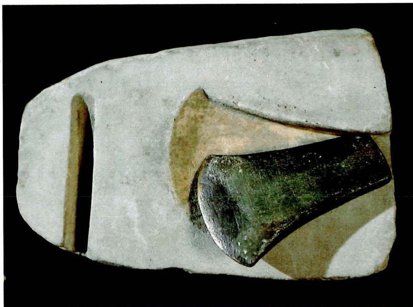
Motle bivalve per a la fabricació de destrals, metàl·liques. Mola Alta de Serelles, de Alcoi.

La presència de forns i àrees de fundició en poblats com la Lloma de Betxí, a Paterna; La Horna, a Aspe, i Penya Negra, a Crevillent, testimonien la puixança de la metal·lúrgia a partir de l'Edat del Bronze.