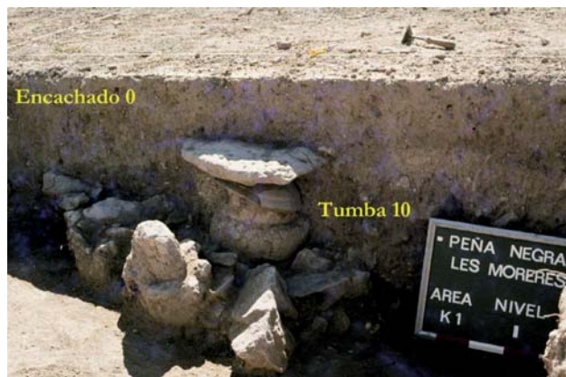
Tombes de cremació davall estructures mitjanes i complexes de la Fase I i conjunt de empedrats de la fase II.