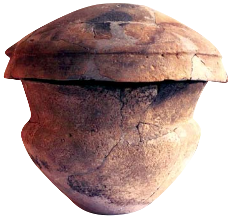
Urna funerària. Tomba 19.

(Colominas, 1915-1920; Bosch Gimpera, 1953; González, 1975; Mata, 1978; Barrachina, 2002-2003). Vegem com és el comportament d'aquesta necròpolis crevillentina.