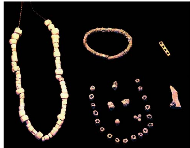
Aixovar funeràri. Tomba 10.

Bàsicament, els diferents tipus de sepultura permeten de ser agrupats en dues grans categories: