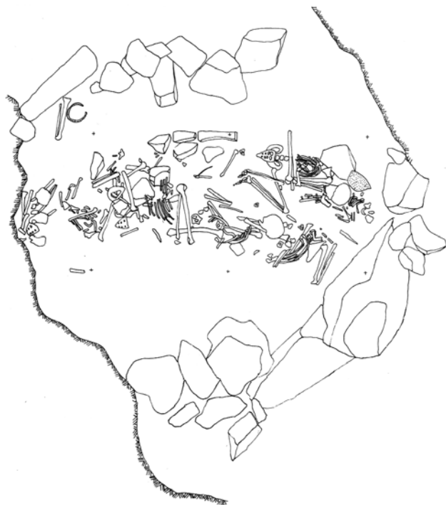
Planta dels enterraments del nivell III.

Enmig de la cova va aparèixer una cambra funerària delimitada per dues grans alineacions de blocs de grans dimensions, perpendiculars a l'eix de la cavitat, en l'interior de la qual es van exhumar les restes de nou esquelets en connexió anatòmica, col·locats en posició decúbit lateral, encollits, amb els braços i les cames plegats