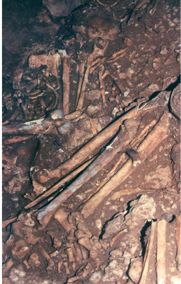
Detall d'una de les inhumacions.

Els nivells IIIA, B i C, que contenen les inhumacions i segellen la cambra i el corredor, reuneixen la major part dels aixovars. Crida l'atenció que aquests estan majoritàriament a l'entrada, fora de l'estructura funerària. Es tracta de ceràmiques llises de formes globulars i de casquet esfèric junt amb una gran gerra amb decoració