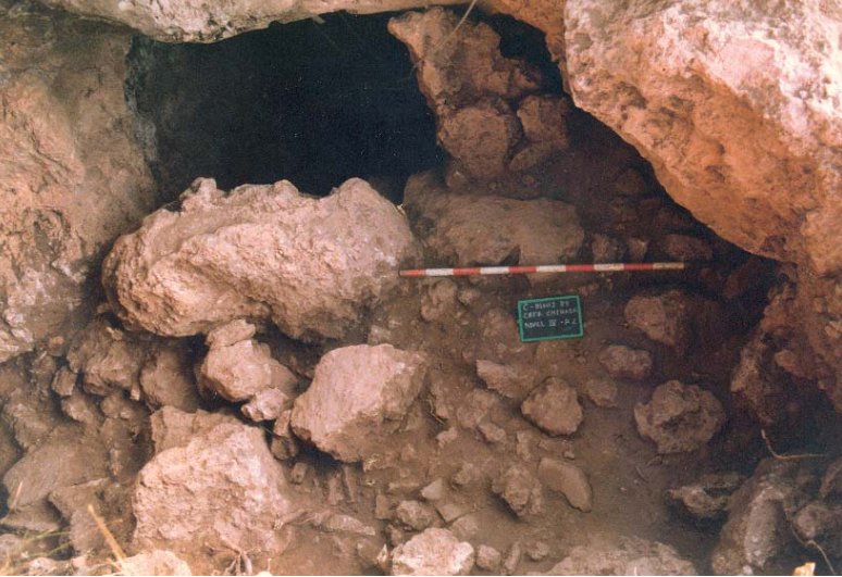
Detall del tancament de Blaus on s'aprecia una llosa recolzada sobre un gran bloc.

dre sentit estructures que fins al moment no havíem estat capaços d'interpretar (Casabó, 2005).